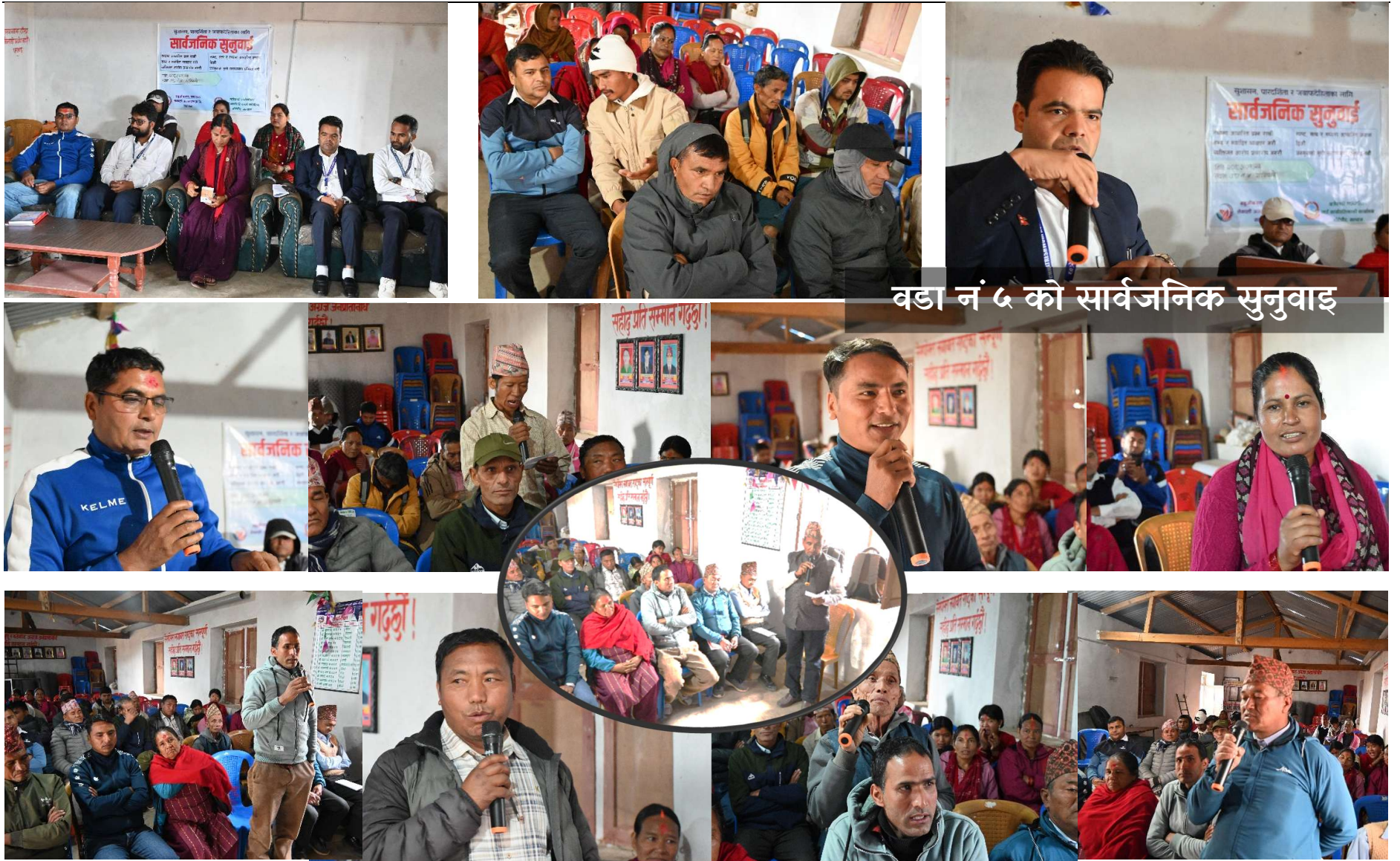
बडा नं ५ को सार्वजनिक सुनुवाइ