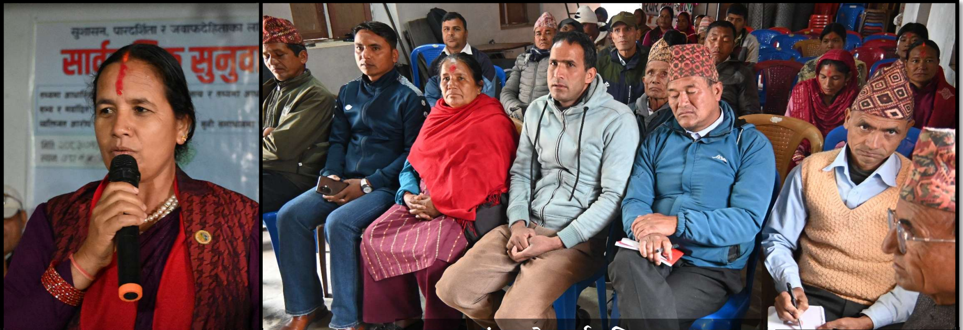
वडा नं ५ को सार्वजनिक सुनुवाइ